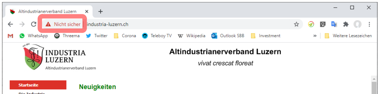
Abbildung 1: Webseite unsicher eingestuft