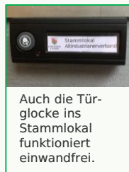
Auch die Tür- glocke ins Stammlokal funktioniert einwandfrei.